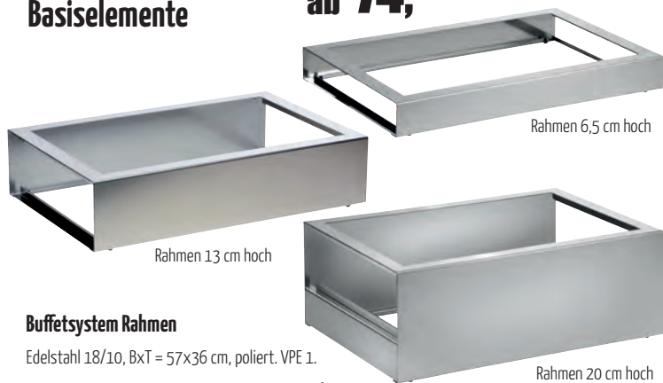
Rahmen 6,5 cm hoch