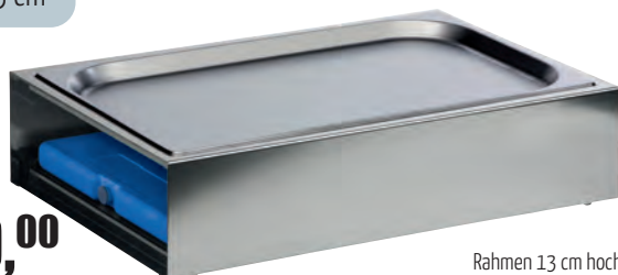
Rahmen 13 cm hoch