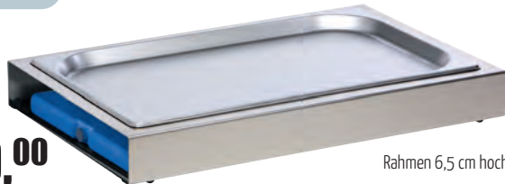
Rahmen 6,5 cm hoch