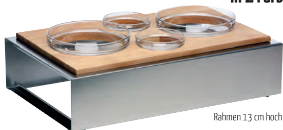
Rahmen 13 cm hoch