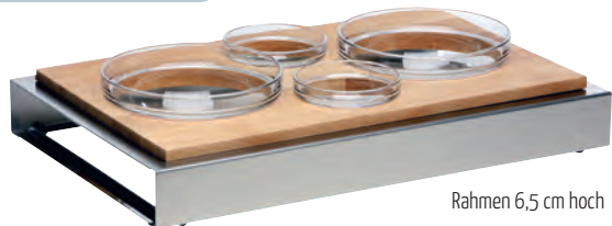
Rahmen 6,5 cm hoch