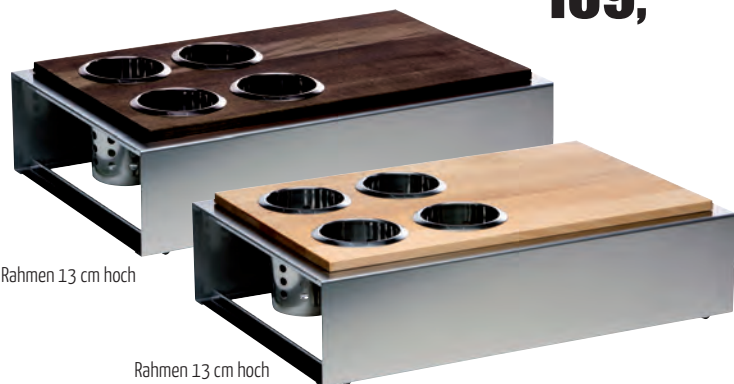
Rahmen 13 cm hoch