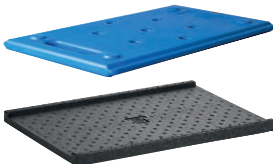
Rahmen 13 cm hoch